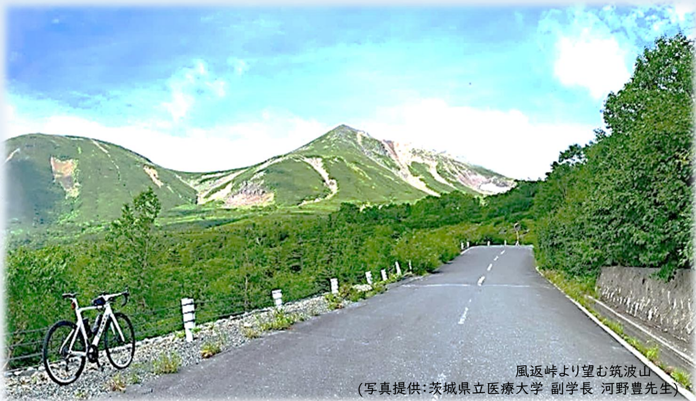
風返峠より望む筑波山

摂食嚥下障害看護『JOURNEY』 ～『生ききる』を支える食支援、その歩みとこれから～