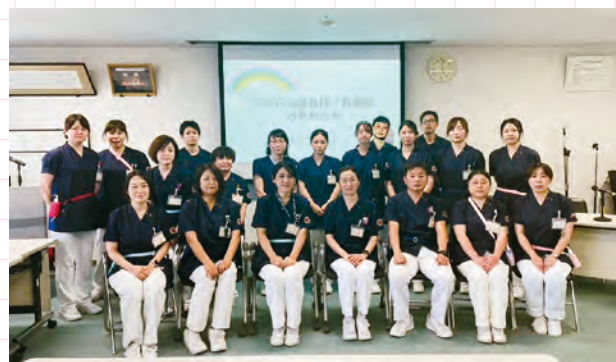
水戸済生会総合病院 特定行為研修修了看護師のみなさん

水戸済生会総合病院は、2018年に特定行為研修機関となり、現在20区分と6つの領域別パッケージを取得できる体制が整っています。院内はもとより、院外からも広く受講生を受け入れ、院内では43名（うち特定認定看護師5名含む）の修了者が活躍しています。修了者は、研修で培ったアセスメント力を活かして、配属先のICUやEHCU、周産期センター、一般病棟、手術室等での活動と、取得区分を活かした横断的な活動を行っています。患者様へ質の高い医療・看護が提供できるよう、今後も修了者が活躍できる環境を整えていきたいと思っています。