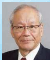
横倉義武共同代表