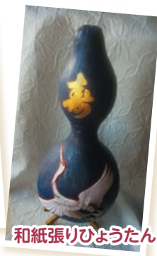
和紙張りひょうたん