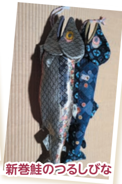
新巻鮭のつるしびな