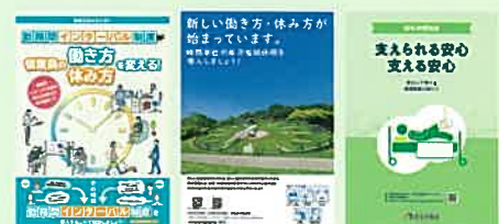
各制度に関するリーフレット(例)

「勤務間インターバル制度」「年次有給休暇の計画的付与制度」「時間単位の年次有給休暇」「特別な休暇制度」などについて、企業の取組事例の紹介や、リーフレットなどの資料を掲載しています。