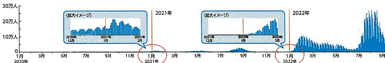
〈日本国内の新規感染者数(1日ごと)〉

これまで2年間、年末年始に新型コロナは流行しています。 2022年の年末まで に、重症化リスクの高い高齢者のもとより、 若い方にも オミクロン株対応2価ワクチンによる接種を完了するようおすすめします。