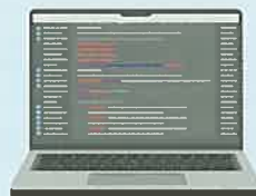
■プログラムソフト