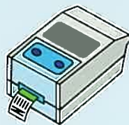
■ラベルプリンター