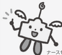
ナースセンターくん

〒314-0039 鹿嶋市緑ヶ丘 3-9-20 (鹿嶋訪問看護ステーション内) TEL : 070-1543-9672 e-mail : ibanc-rokkou@ina.or.jp 相談日 : (火) (木) 9:30 ~ 15:30