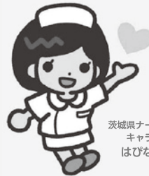
茨城県ナースセンター キャラクター はびなちゃん

〒307-0001 結城市結城 1211-7 (茨城県結城看護専門学校内) TEL : 070-1544-1383 e-mail : ibanc-kensei@ina.or.jp 相談日 : (月) (水) 9:30 ~ 15:30