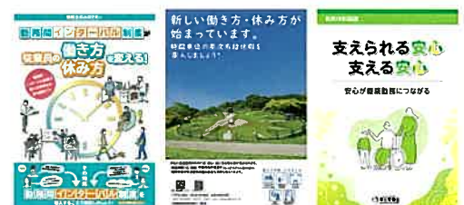
各制度に関するリーフレット(例)

「勤務時間インターバル制度」「時間単位の年次有給休暇制度」「特別な休暇制度」などについて、企業の取組事例の紹介や、リーフレットなどの資料を掲載しています。自社における制度検討の参考にご活用ください。