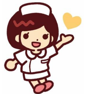
茨城県ナースセンター キャラクター はびなちゃん